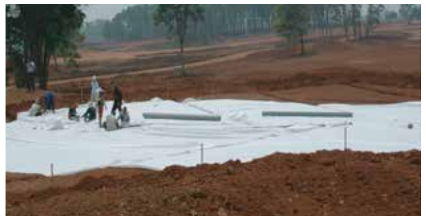
PROTEKSI BUNGER GOLF - ROYAL GOLF HALIM