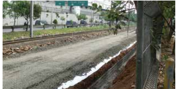
DOUBLE TRACK TANAH ABANG - SERPONG

Aplikasi : pelapis pada kolam limbah/ non limbah, danau buatan, tempat pembuangan sampah, penampungan batu bara, dll