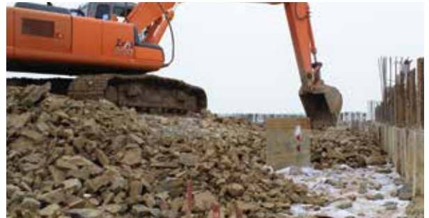
FILTRASI PLTU - TANGERANG

Biasa diaplikasikan pada revetment, riprapp pantai, dibelakang konstruksi bronjong/gabion, copastal breakwater, jetty, dapat mereduksi terjadinya gerusan akibat air balik pada slope.