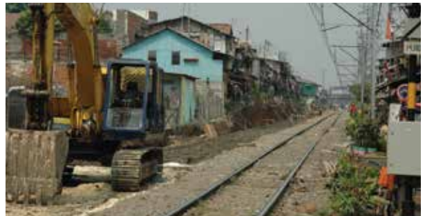
SEPARASI KOMUTER LINE - JAKARTA - TANGERANG