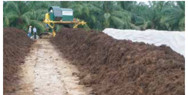
COVER COMPOS ASTRA ARGO LESTARI - KALIMANTAN

Aplikasi : Cover batu bara, compos, dinding, dll.