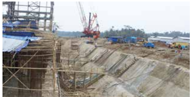
PROTEKSI MEMBRAN KOLAM WATER TREATMENT - TANGERANG