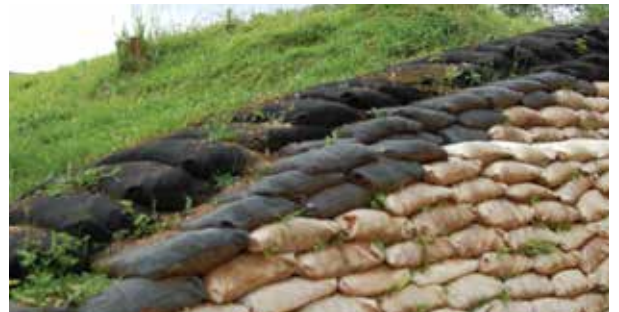
GIOBAG PROTEKSI - CIKALONG