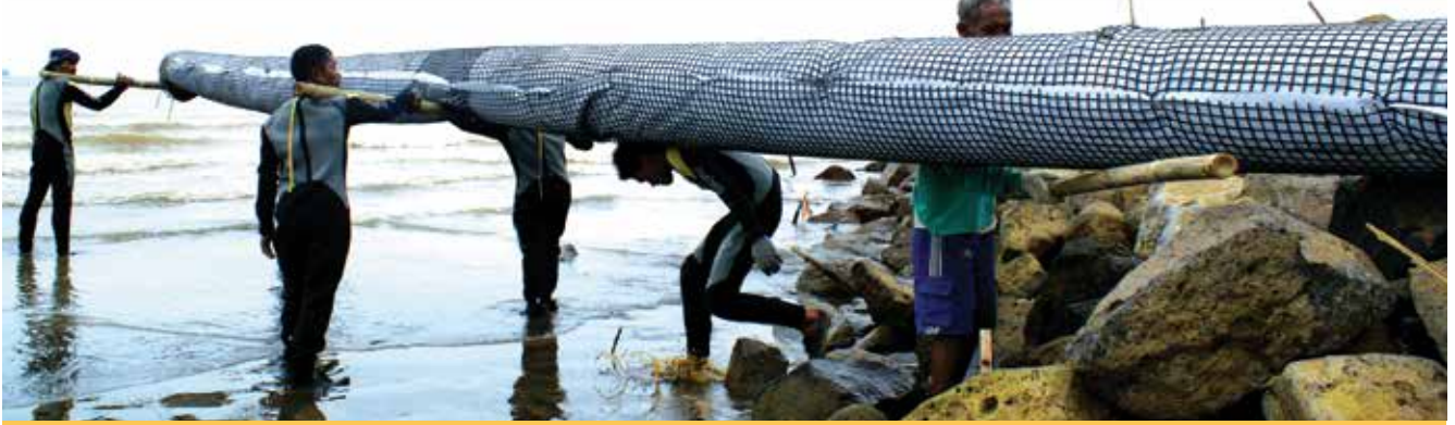
REKLAMASI PLTU TELUK NAGA - TANGERANG