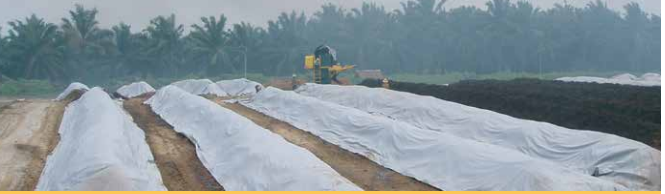
COVER COMPOS ASTRA ARGO LESTARI - KALIMANTAN