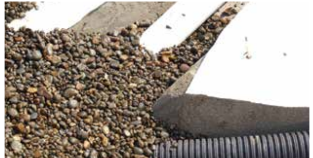
DRAINASI BUNGER GOLF - ROYAL GOLF HALIM

Aplikasi : Konstruksi penahan abrasi pantai, pipa drainase berperforasi, jetty, rip-rap, pemecah gelombang laut, dll