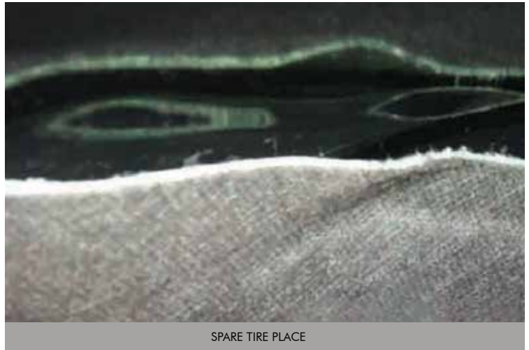
SPARE TIRE PLACE