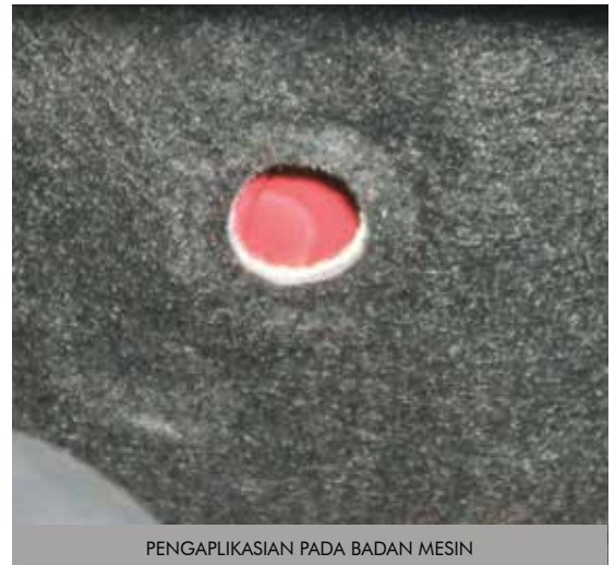
PENGAPLIKASIAN PADA BADAN MESIN