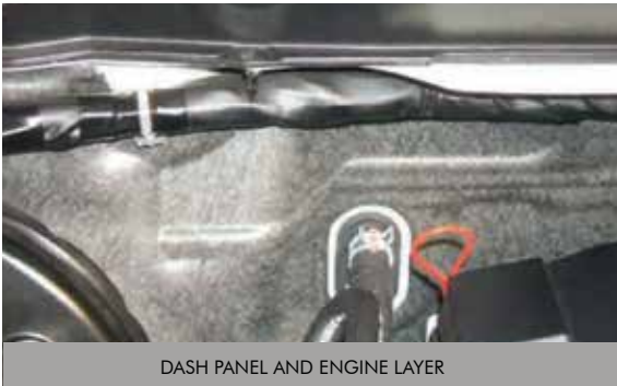
DASH PANEL AND ENGINE LAYER