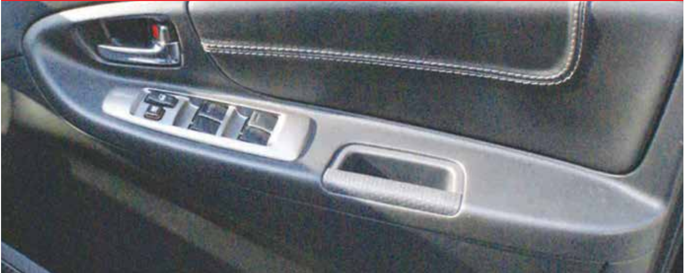
PENGAPLIKASIAN PADA PINTU SEBAGAI PEREDAM (DOOR TRIM)